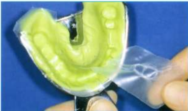
Abb. 3: Die tiefgezogene Folie lässt sich rückstandsfrei abziehen. Der Vorabdruck ist in der Funktion ein individueller Löffel und kann ohne weitere Bearbeitung als solcher verwendet werden.