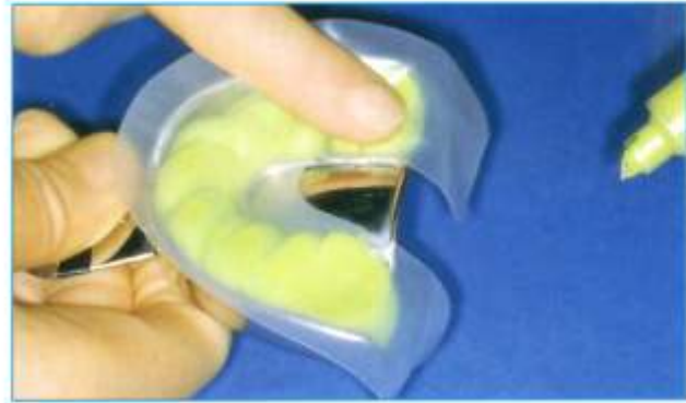
Abb. 2: Plicafol -Trennfolie wird aufgelegt und angedrückt. Der Löffel mit Putty und Folie wird in den Mund gegeben und fest aufgespresst.