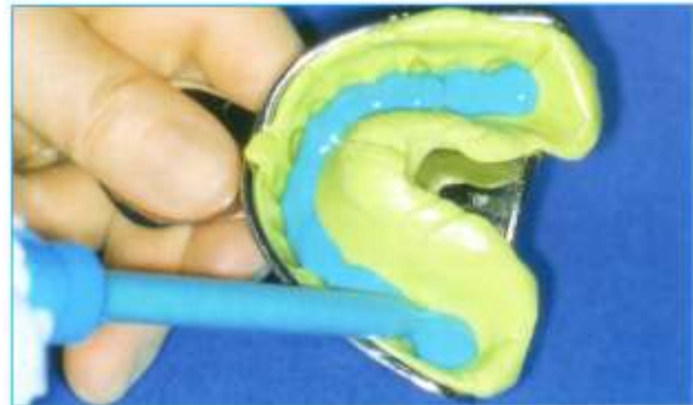
Abb. 4: Das Abformmaterial wird in einer durchgehenden gleichmäßigen Schicht von zwei bis drei Millimeter Dicke in den gesamten Löffel gegeben.

reicht. Die Folie dehnt sich und umfließt die Zähne. Sie kann nach der Entnahme leicht und rückstandsfrei von dem ausgehärteten Putty abgezogen werden. Das Resultat ist ein stark vergrößerter Abdruck, in Aussehen und Funktion vergleichbar mit einem individuellen Löffel, ohne die bei anderen Folien übliche Faltenbildung und ohne Überhänge (Abb. 3). Diese Vorabformung kann sofort ohne weitere Bearbeitung entweder als Erstabdruck für die Korrekturabformung oder im Verfahren einer Einphasenabformung als individueller Abformlöffel weiterverwendet werden.