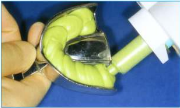
Abb. 1: Ein konfektionierter Abformlöffel wird zu zwei Dritteln mit Panasil binetics putty fast befüllt.