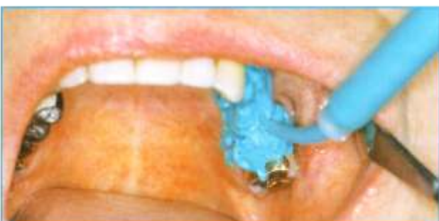
Abb. 5: Die Details der Präparation und die Sulkusregion werden im Mund umspritzt.

Die nun folgenden Arbeitsschritte stellen die eigentliche Abformung dar. Zunächst wird das Korrekturmateriale Panasil contact two in one in einer Dicke von 2 bis 3 Millimetern in den gesamten Löffel gegeben (Abb. 4). Danach oder gleichzeitig wird die Präparation in der üblichen Weise im Mund umspritzt (Abb. 5). Der Löffel wird nun eingebracht, mit mäßigem Druck aufgespresst, bis zum vollständigen Aushärten gehalten und axial abgezogen. Die fertige Abformung zeigt die für die Folienabformung typische Verteilung der Materialphasen mit einer für die Anwender der klassischen Korrekturabformung ungewohnt starken Schichtstärke des Korrekturmateriale und ohne die für den Doppelmischabdruck typi-